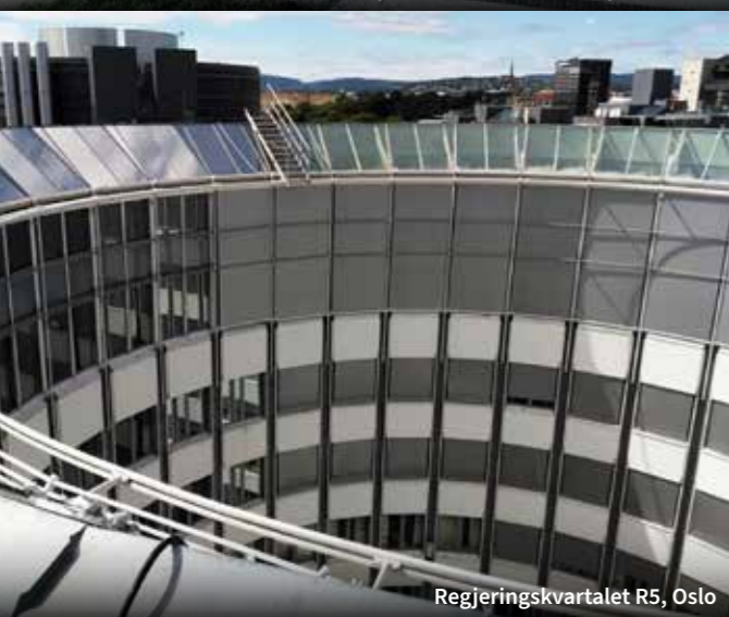
Regjeringskvartalet R5, Oslo