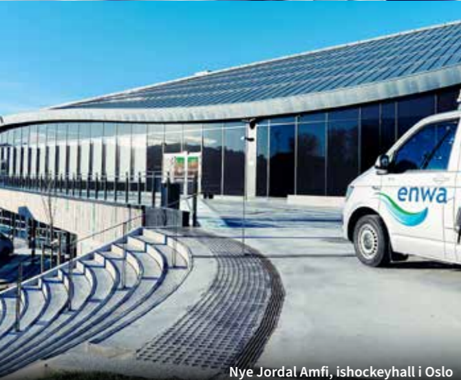
Nye Jordal Amfi, ishockeyhall i Oslo