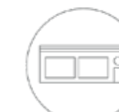
Kontor- og butikklokaler